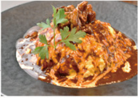
ビーフシチュー on オムライス ¥850