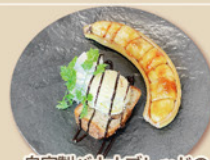
自家製バナナブレッドの まるdeバナナ ¥600