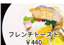
フレンチトースト ¥440