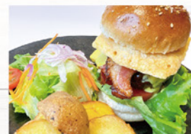
牛 100% Soma バーガー ¥990