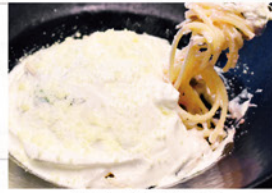
イカと明太子の クリームスパゲッティ ¥990