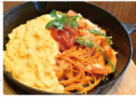
スキレット オムナポリタン ¥900