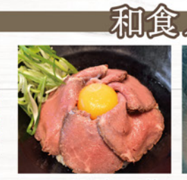
ローストビーフ丼 ¥1,320