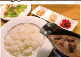
欧風ビーフカレー ¥850