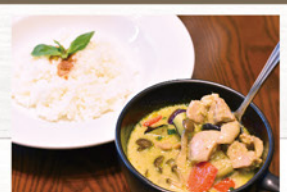
チキンと野菜の グリーンカレー ¥990