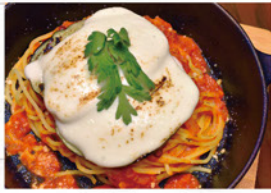
スキレット ナスとモッツアレラチーズの アラビアータ ¥990