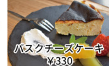
バスクチーズケーキ ¥330