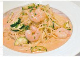
海老と季節野菜の トマトクリームパスタ ¥990