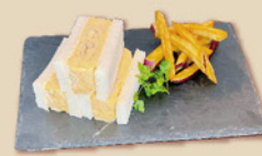
あま〜いだしまき玉子サンド ¥660