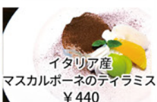
イタリア産 マスカルポーネのティラミス ¥440