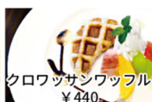
クロワッサンワッフル ¥440