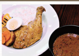
骨付きもも肉の スープカレー ¥990