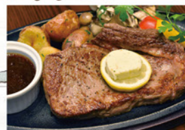
ポリウム満点 熱々鉄板ステーキ ¥1,650