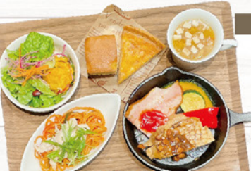
ジェフの目替わりパスタと よくばりプレートランチ ¥1,210