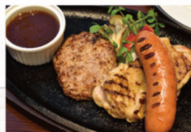
鉄板 ミックスグリル ¥1,320