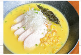
コーンポタージュ ラーメン ¥900