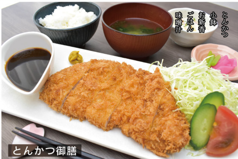
とんかつ 小鉢 お新香 ごほん 味噌汁