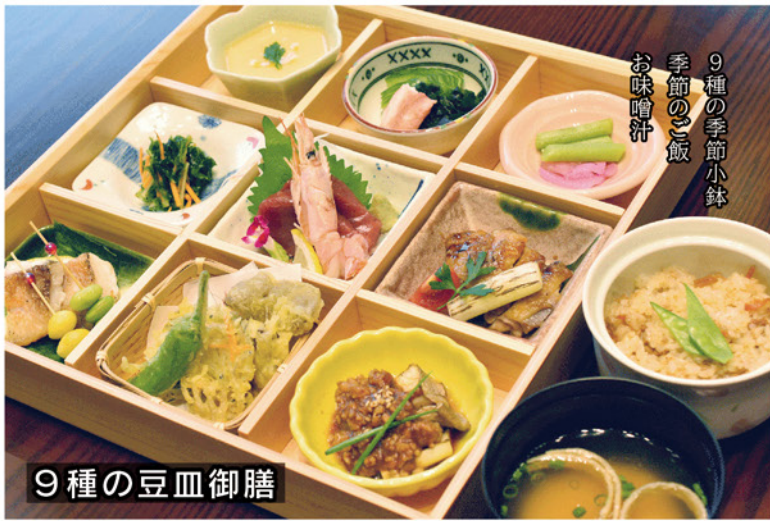
9種の季節小鉢 季節のご飯 お味噌汁