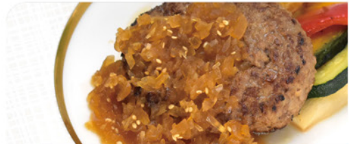
自家製和風オニオンソース