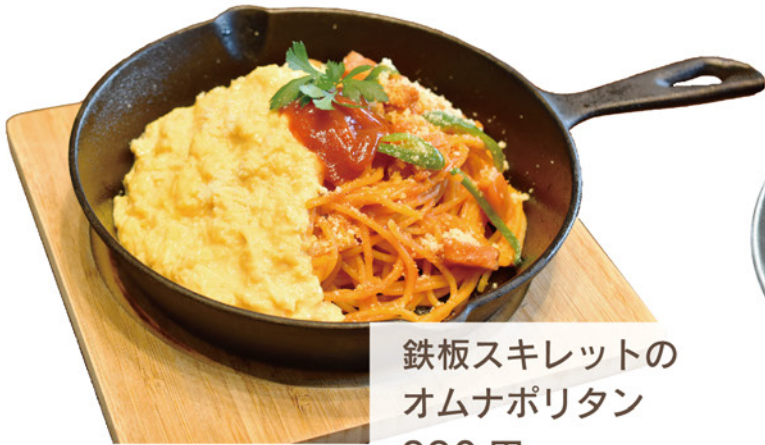
鉄板スキレットの オムナポリタン