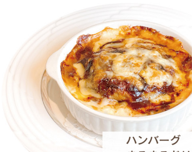
ハンバーグ まるまるドリア