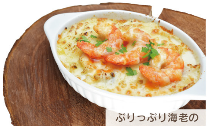
ぷりっぷり海老の マカロニグラタン