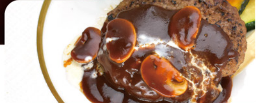
自家製デミグラスソース