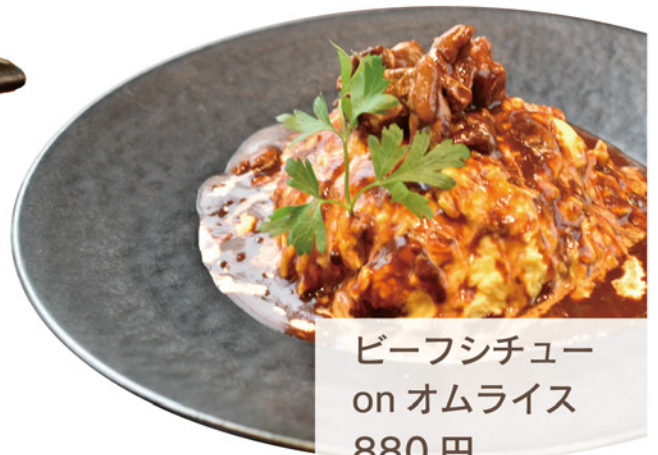
ビーフシチュー on オムライス