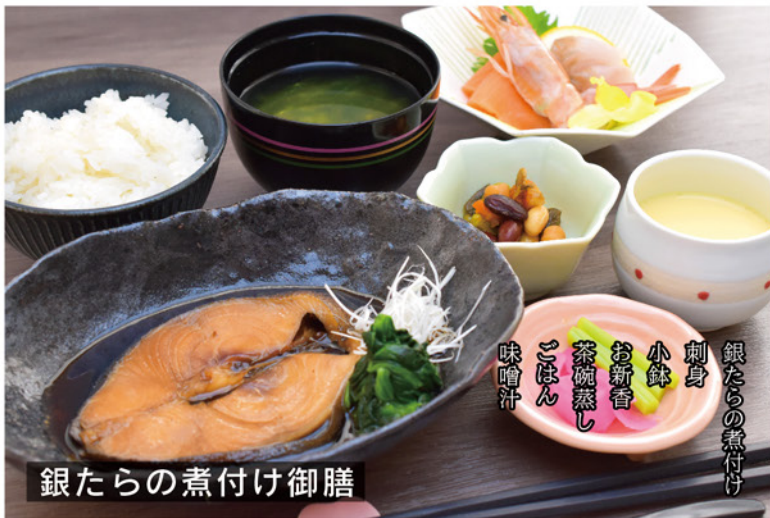
銀たらの煮付け 刺身 小鉢 お新香 茶碗蒸し ごほん 味噌汁